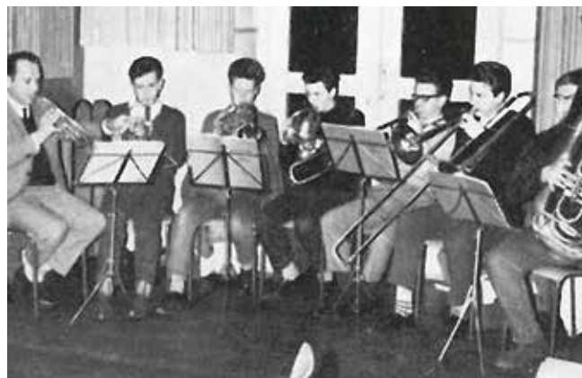
damals – 1964