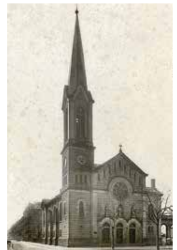
Johanniskirche von Nordosten, um 1900

Das Erbgroßherzogspaar gab sein Hochzeitsgeschenk, drei Stahlglocken von der Gusstahlfabrik des Bochumer Vereins, Prinzessin Vicky von Baden – die spätere Königin von Schweden und Norwegen – stiftete den Abendmahlkelch mit Patene. Während die Stahlglocken im Krieg Rüstungszwecken nicht dienlich waren und daher bis heute zum Gottesdienst läuten, fiel die Kirchenfassade mit den Reformatorenstandbil-